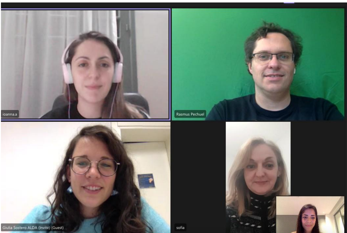
Radex's partners meeting hold online in December 2021

Trouvez-vous ce contenu intéressant? Y a-t-il quelque chose que vous souhaitez ajouter ou commenter ? N'hésitez pas à le faire en nous contactant à l'adresse radex@rj4all.org . Ne manquez aucune mise à jour en suivant notre page facebook !